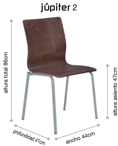
Tabla de precios